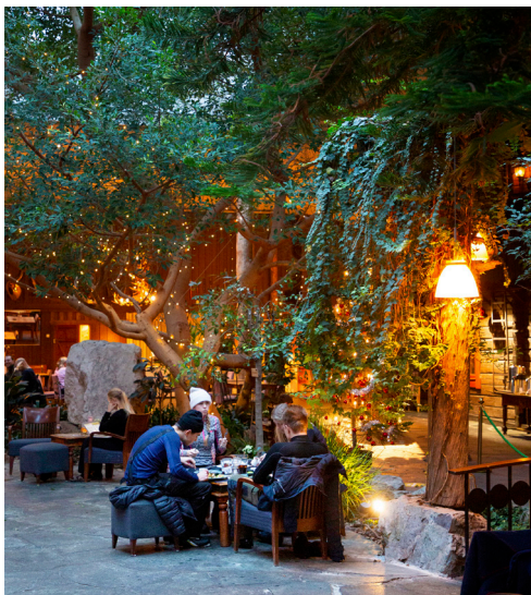
Det anrika högfjällshotellet i Storhogna välkomnar med en frodig vinterträdgård.

landets mest expansiva alpinområde. De senaste åren har flera nya expressliftar och nya nedfarer anlagts och i Skalspasset finns ett helt nytt område med sexstolslift.